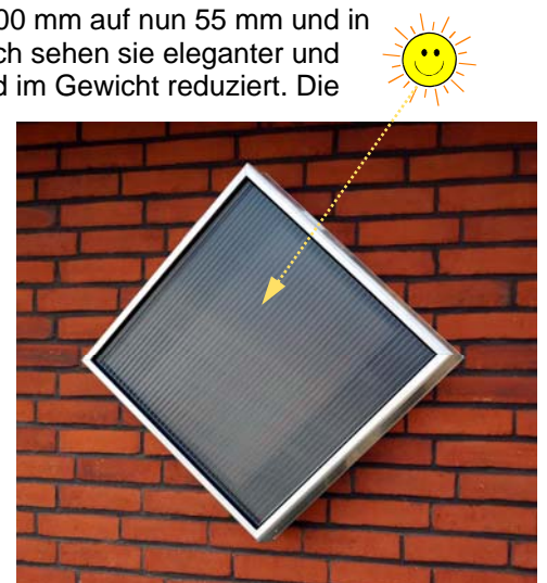
SolarVenti SV 2

Der Regulator zur Steuerung der Ventilatorengeschwindigkeit erfreut sich im neuen Design und kann mehrere zusätzliche Funktionen wahrnehmen.